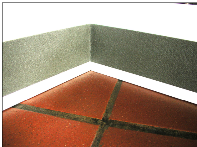
Рис. 5 Алюминиевую кромку в области внутреннего и внешнего углов срезать под углом 45°.