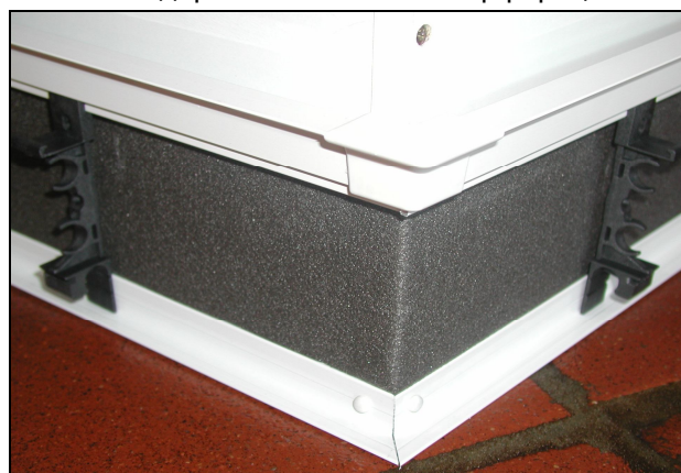
Рис. 8 AS: Верхняя часть внешнего угла надевается на клювообразный профиль. Расстояние до держателей 15 см слева и справа.

В области торцевой заглушки (ES) клювообр. профиль должен быть укорочен на 1 см!!!!