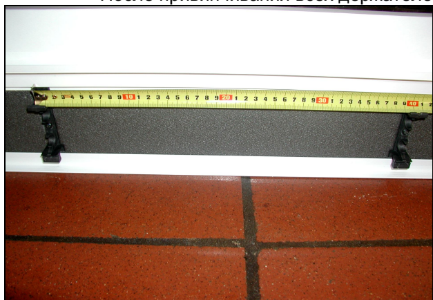
Рис. 7 TR: Между держателями должно быть расстояние 40 см. Ни в коем случае не более 40 см!