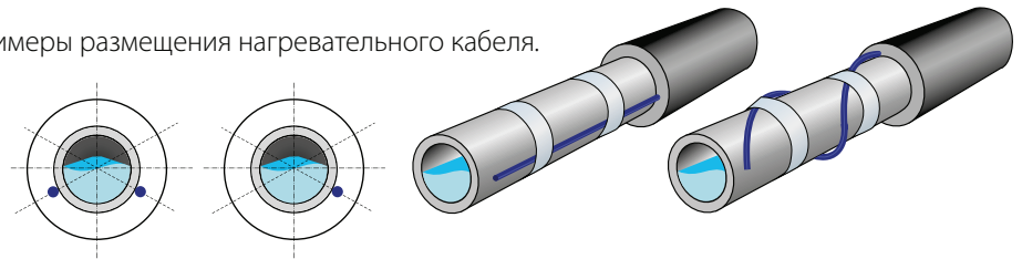
Рисунок 3. Примеры размещения нагревательного кабеля.

Концевую муфту и нагревательный кабель необходимо крепить к трубе на 4 или (и) 8 часов в одну или две нитки, либо повивом (рис. 3). Расположение нагревательного кабеля в нижней части трубы исключает вероятность его повреждения при возможной механической нагрузке на трубопровод сверху (падение предметов, инструментов). А также именно этот участок трубы нуждается в максимальном нагреве, так как замерзание жидкости всегда идёт снизу.